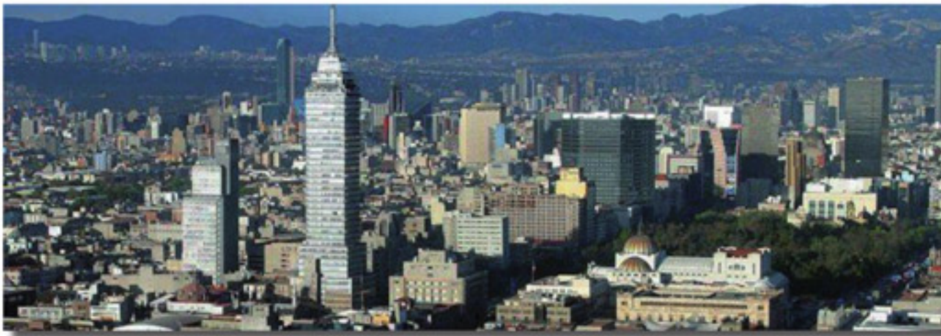
Panorámica de México, Distrito Federal

México. Del 30 de Septiembre al 2 de Octubre, 2015