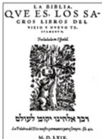
Biblia del Oso