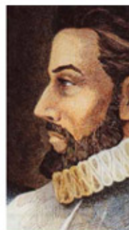
Cipriano de Valera