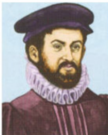
Casiodoro de Reina

Escrito por JUAN MANUEL QUERO MORENO Viernes, 01 de Julio de 2016 00:00