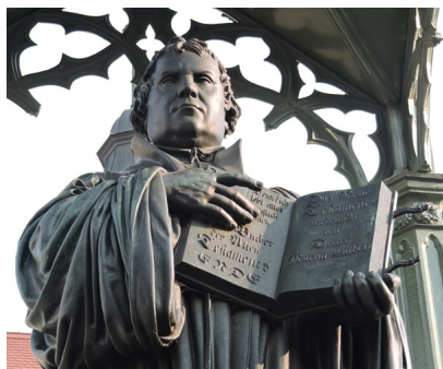
Estatua de Martín Lutero en Wittenberg

( JORGE FERNÁNDEZ , 26/10/2017) Como se sabe, este año 2017 se celebra, con mayor o menor eco social y mediático según la región del mundo que se trate, el 500º Aniversario de la Reforma Protestante. En Alemania, cuna universal del protestantismo, los festejos comenzaron el 21 de septiembre de 2008, cuando se declaró la Década de Lutero y se ha venido desarrollando un tema cada año, relacionado con la Reforma (Reforma y libertad, Reforma y educación, Reforma y confesión, etc.).