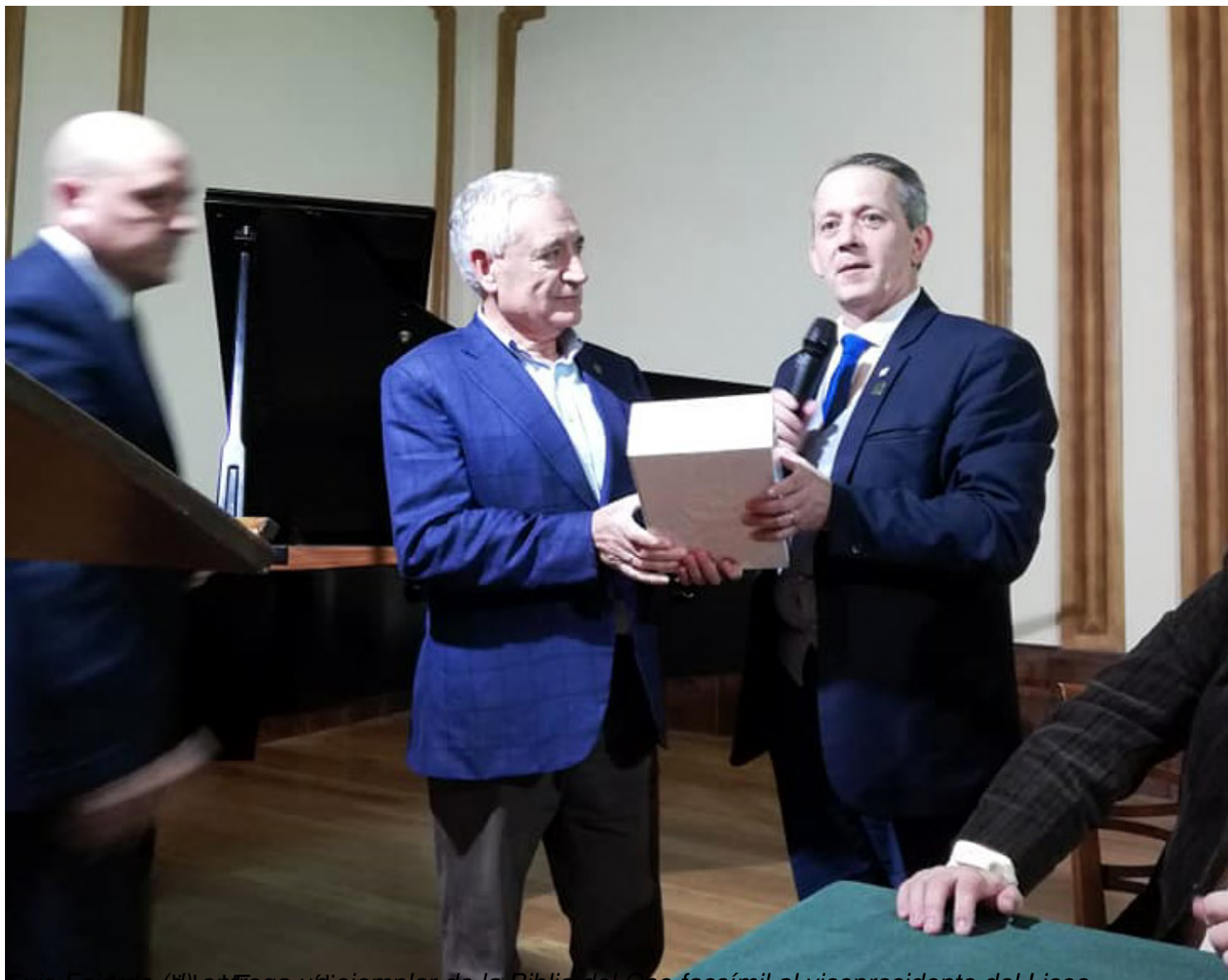
Entrega de un ejemplar de la Biblia del Oso facsímil al vicepresidente del Liceo

Escrito por Actualidad Evangélica Viernes, 29 de Noviembre de 2019 19:06