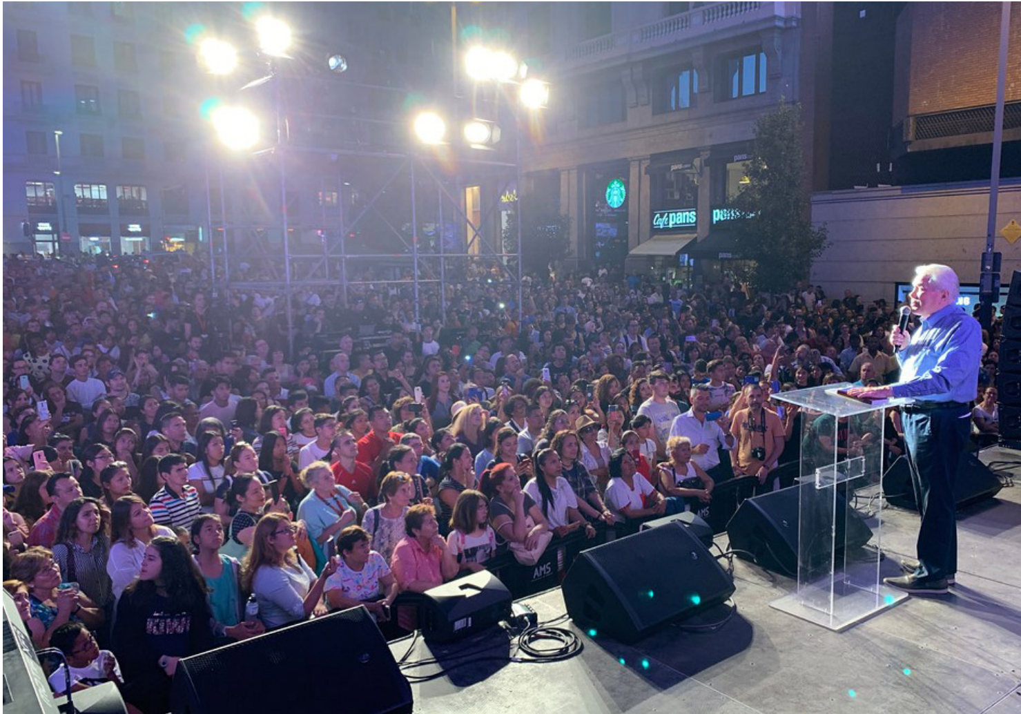
Luis Palau predicando en la Plaza del Callao en Madrid, viernes 21 de junio de 2019

(EDITORIAL, 02/07/2019) En las últimas semanas nos hemos “sumergido”, literalmente, en FestiMadrid 2019 , priorizando la cobertura informativa de este gran evento unido de las iglesias evangélicas de Madrid a cualquiera otra noticia.