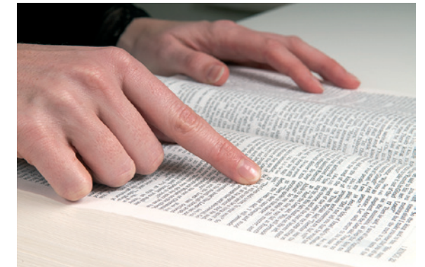
Jesús está presente en toda la Biblia, por eso se dice que esta es crístocéntrica.

Como sabes, el Antiguo Testamento se escribió antes de que Jesús naciese, pero los libros de este periodo nos apuntan diferentes realidades que después se cumplirán en la vida de Cristo. Existen también muchos textos que nos hablan de distintos aspectos de su vida y de lo que Él iba a hacer. Todo esto aparecerá reflejado en varios libros del Nuevo Testamento.