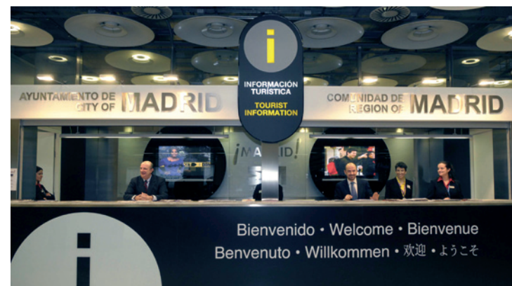
Punto de información en la Terminal 4 del Aeropuerto de Barajas (Madrid)

Del mismo modo, en la Biblia encontramos toda la información necesaria para conocer a Jesús.