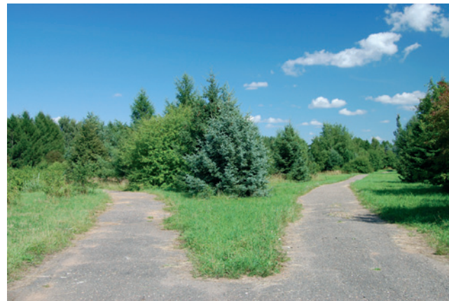
Camino que se bifurca.

La verdadera sabiduría, según Dios, no depende de la cantidad de información que podemos acumular, sino de cómo afecta ese conocimiento a nuestra vida. Dios quiere que conozcamos su Palabra, pero más importante aún es que Dios quiere que vivamos su Palabra.