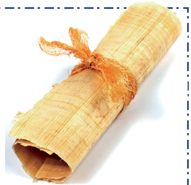
Los libros del Antiguo Testamento fueron escritos originalmente en rollos de papiro por unos 30 autores.

Para ello, cerca de 30 autores diferentes (entre profetas, sacerdotes, reyes y líderes de Israel) escribieron los 39 libros del Antiguo Testamento. La mayoría fueron escritos en hebreo, salvo dos, redactados en arameo. Los libros tenían un propósito común. Para descubrirlo tienes que conocer el Antiguo Testamento.